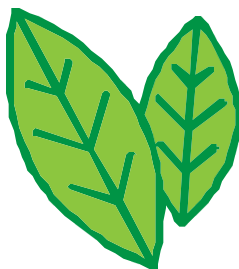
une feuille de bouleau