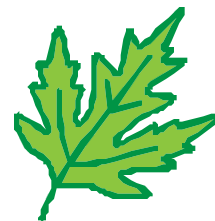
une feuille d'érable

La feuille d'érable est un symbole du Canada.