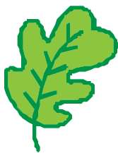
une feuille de chêne

5. Peux-tu identifier ces feuilles? De quels arbres proviennent-elles? Laquelle est un symbole du Canada?